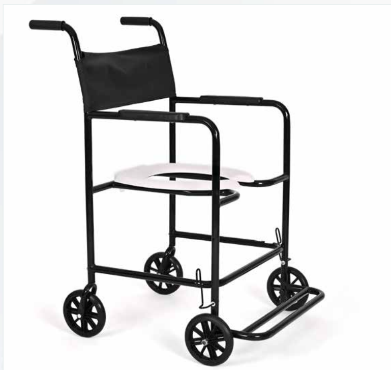
Imagem meramente ilustrativa Sujeito a alteração sem aviso prévio