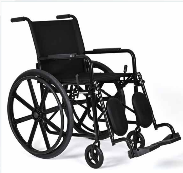
Imagem meramente ilustrativa Sujeito a alteração sem aviso prévio