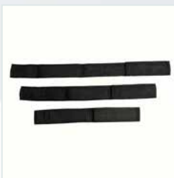
Faixa para pernas