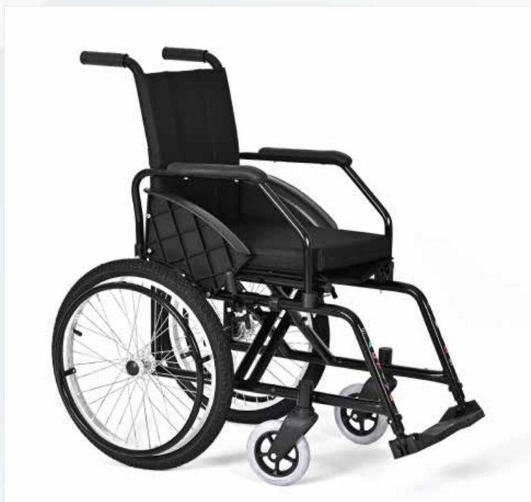
Imagem meramente ilustrativa Sujeito a alteração sem aviso prévio