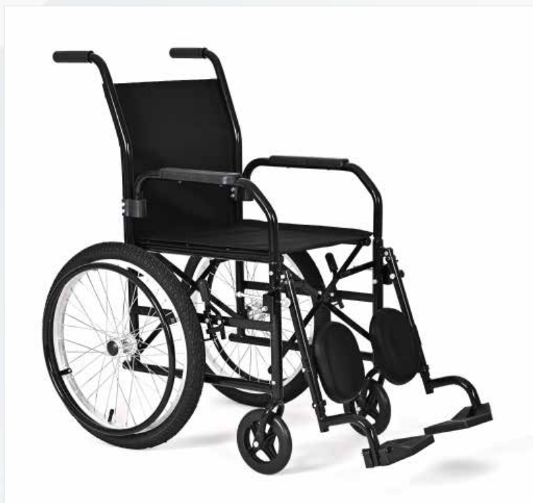
Imagem meramente ilustrativa Sujeito a alteração sem aviso prévio