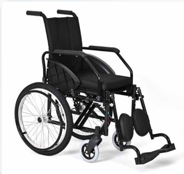
Imagem meramente ilustrativa Sujeito a alteração sem aviso prévio