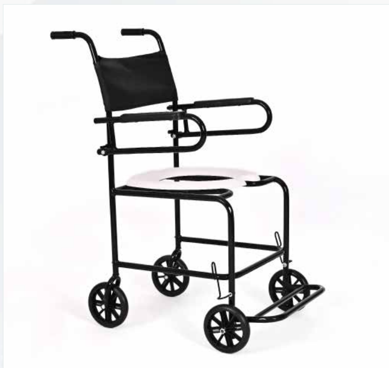
Imagem meramente ilustrativa Sujeito a alteração sem aviso prévio