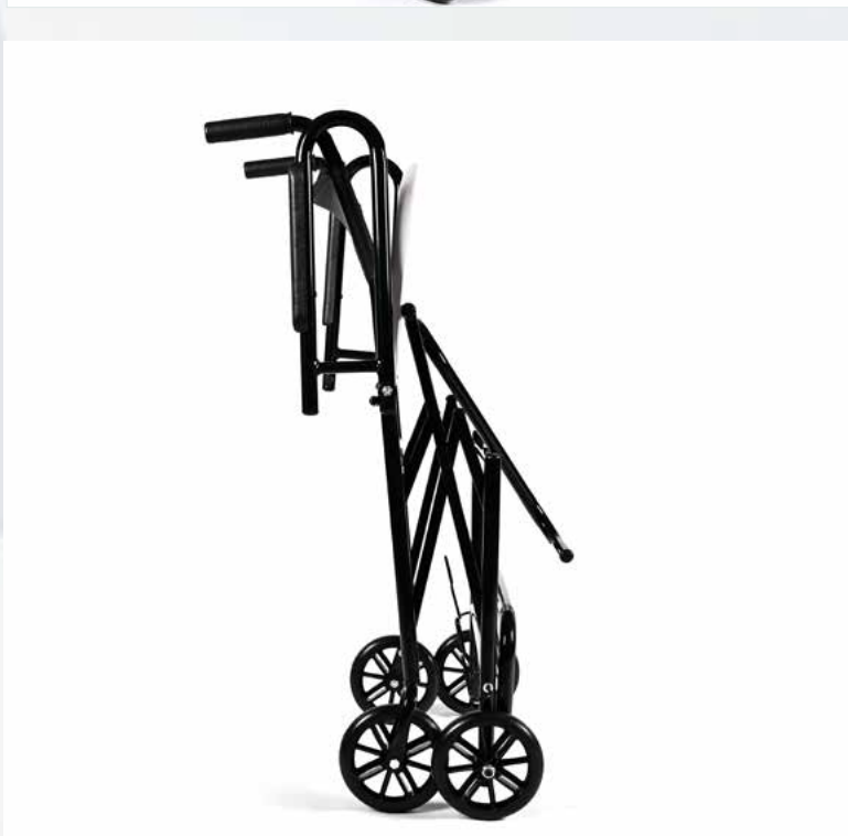
Imagem meramente ilustrativa Sujeito a alteração sem aviso prévio