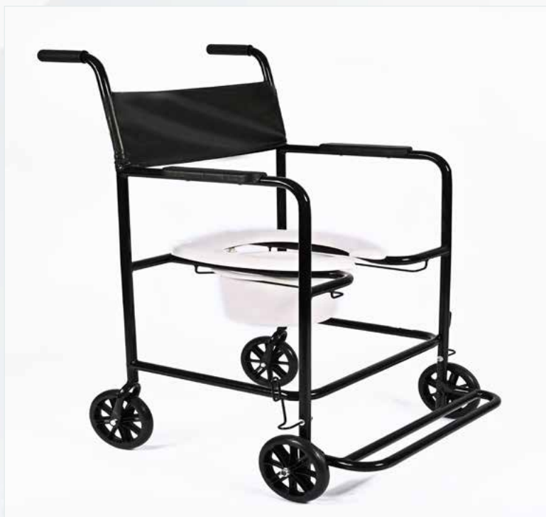
Imagem meramente ilustrativa Sujeito a alteração sem aviso prévio