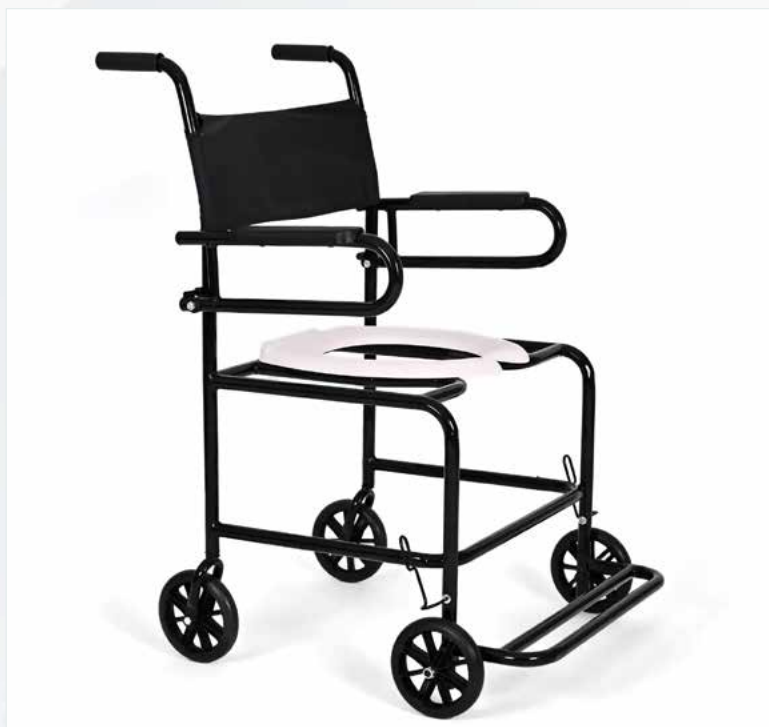
Imagem meramente ilustrativa Sujeito a alteração sem aviso prévio