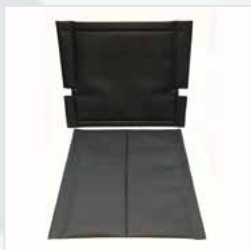
Kit assento/encosto almofadado