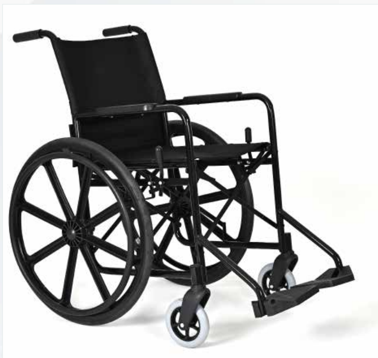
Imagem meramente ilustrativa Sujeito a alteração sem aviso prévio