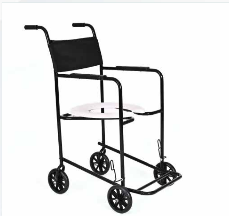
Imagem meramente ilustrativa Sujeito a alteração sem aviso prévio