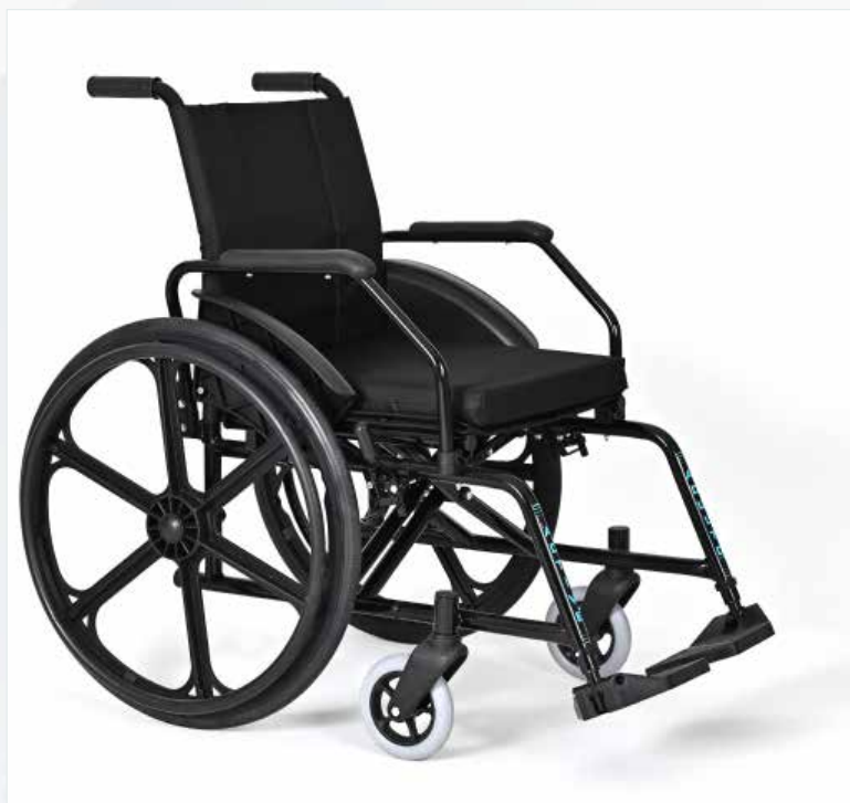
Imagem meramente ilustrativa Sujeito a alteração sem aviso prévio