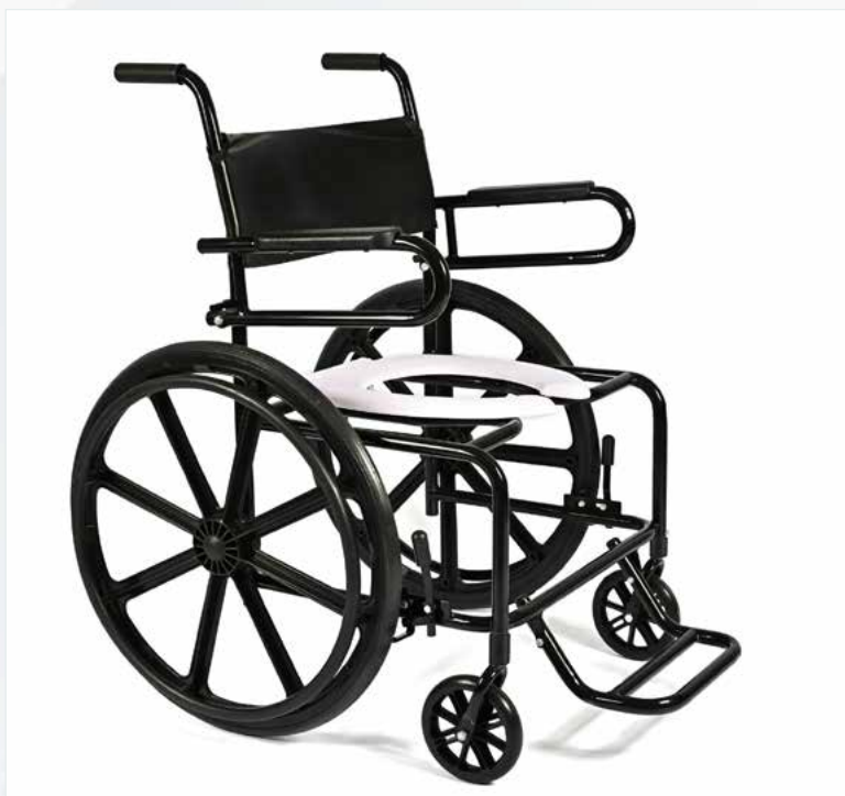
Imagem meramente ilustrativa Sujeito a alteração sem aviso prévio