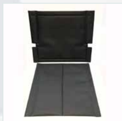
Kit assento/encosto almofadado