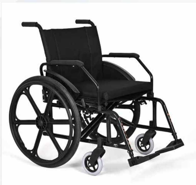
Imagem meramente ilustrativa Sujeito a alteração sem aviso prévio