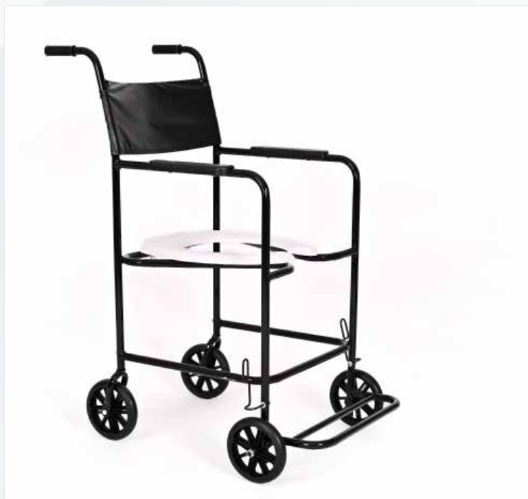
Imagem meramente ilustrativa Sujeito a alteração sem aviso prévio