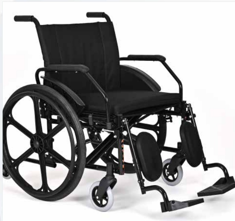
Imagem meramente ilustrativa Sujeito a alteração sem aviso prévio